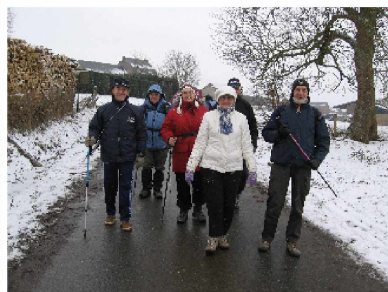
Chevetogne, le 14 février