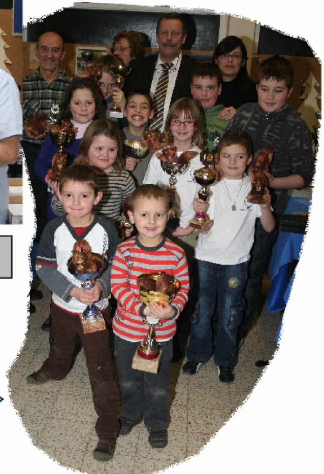
Nos enfants >>>>>