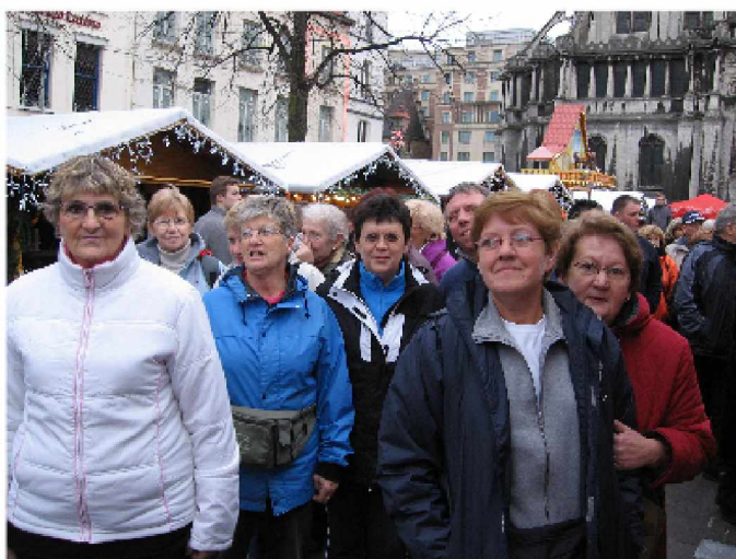
Bruxelles le 29 novembre 2009