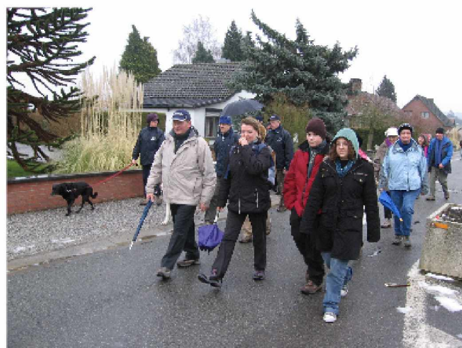
Roselies, le 17 février