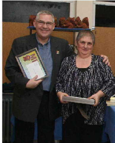
25 & 30 années de fidélité au club