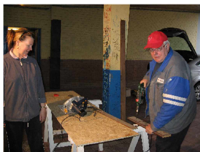
Février - Travaux au local