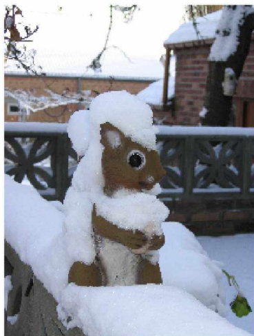
Châtelet, Le 13 janvier