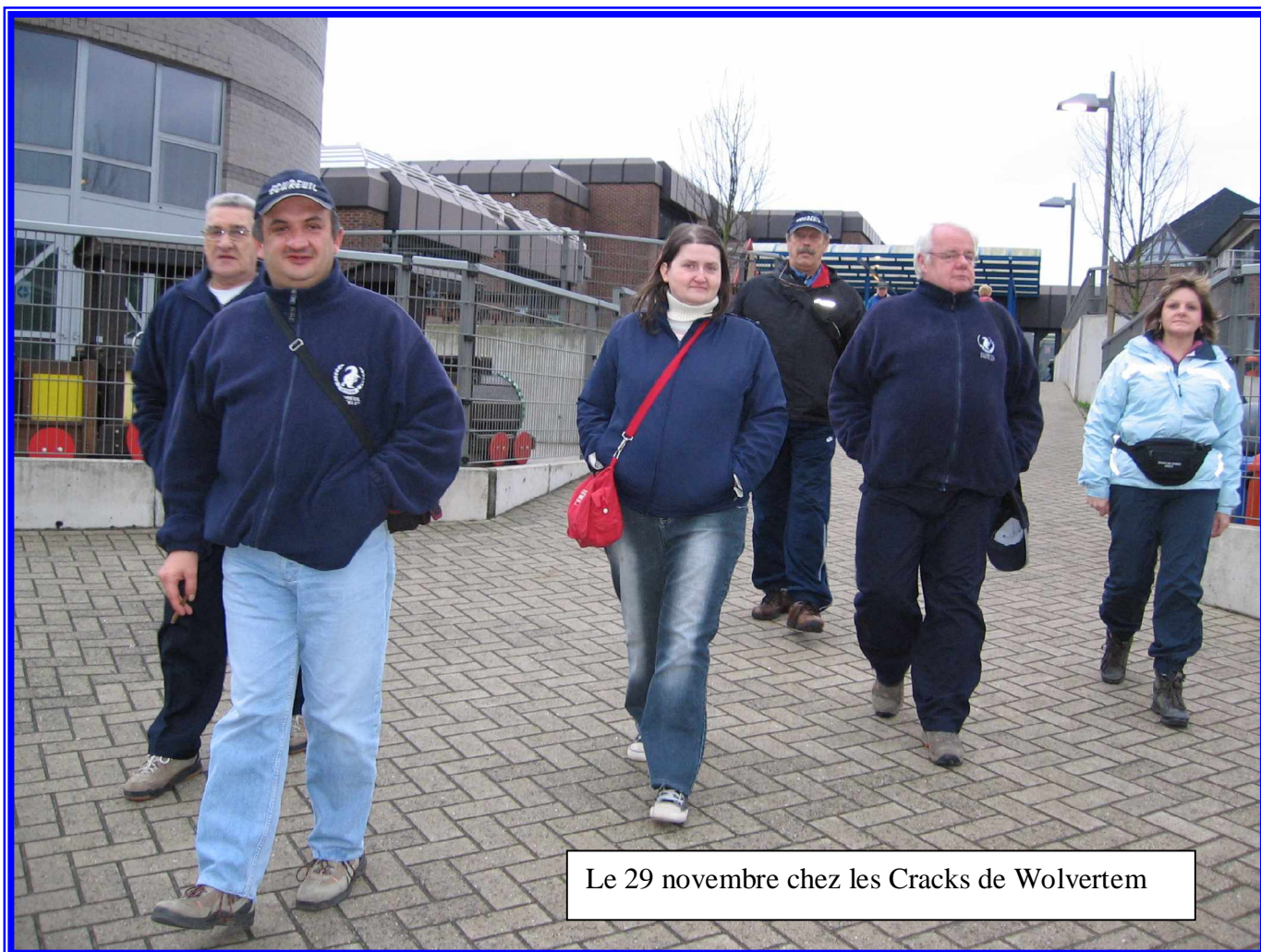
Le 29 novembre chez les Cracks de Wolvertem