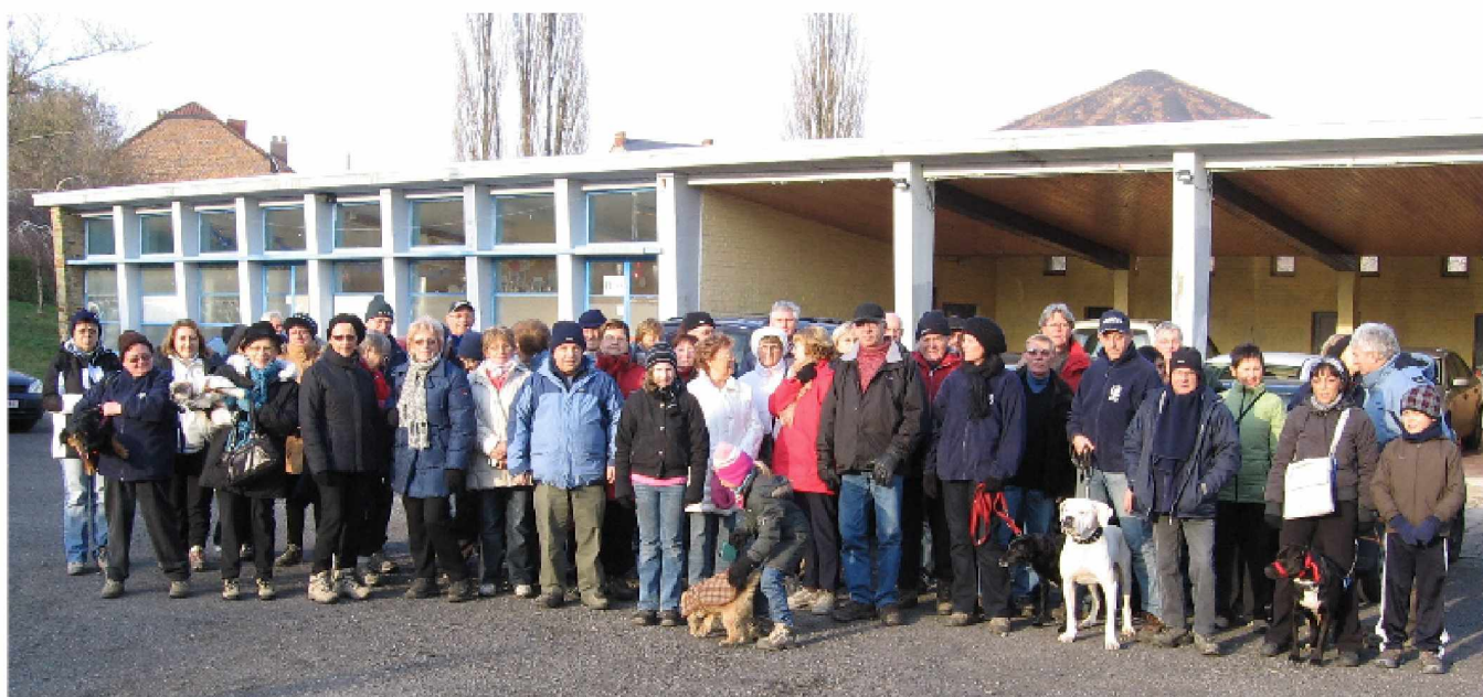
Bouffioux le 16 décembre 2009