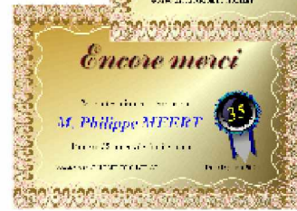
35 années de fidélité au club