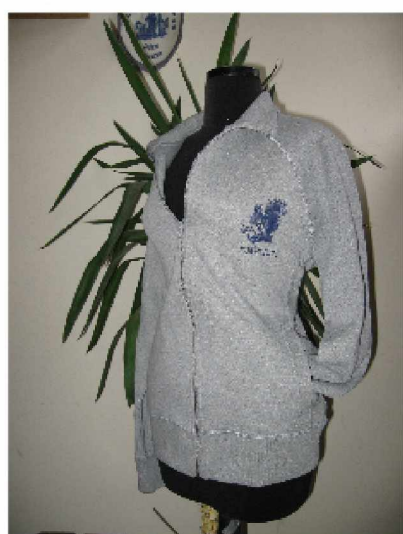
Nouveautés à la boutique